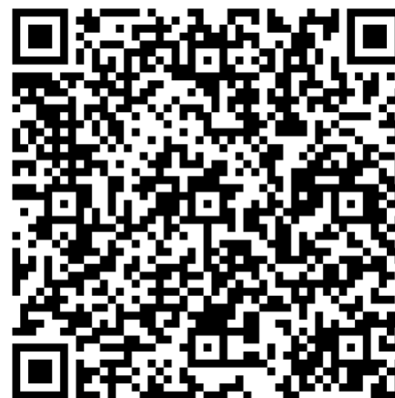
Приложение для iOS

Вам необходимо навести камеру на соответствующий штрих-код и перейдите на страницу загрузки приложения «Личный кабинет предпринимателя» ФНС России для Вашего смартфона.